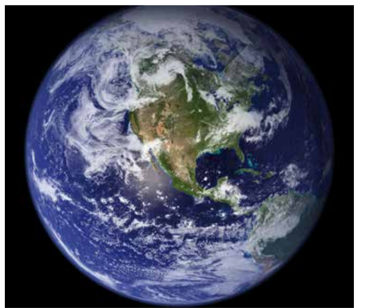
Em síntese, se na década de 1970 o Dia da Terra surgiu como forma de conscientizar e lutar contra a poluição, na atualidade a proposta é buscar uma reflexão mais complexa e profunda para viver em harmonia com a natureza.

Em outros anos, a campanha já abordou a importância de uma economia que se preocupe com a Terra (Invista no nosso planeta, 2023), focar em uma vida sustentável em harmonia com a natureza (Uma Só Terra, 2022), a necessidade de recuperar recursos naturais (Restaurar nossa Terra - 2021), os cuidados com as mudanças de temperatura no globo (Ação Climática, em 2020), ou como evitar a extinção do próprio ser humano (Proteger nossa espécie - 2019).