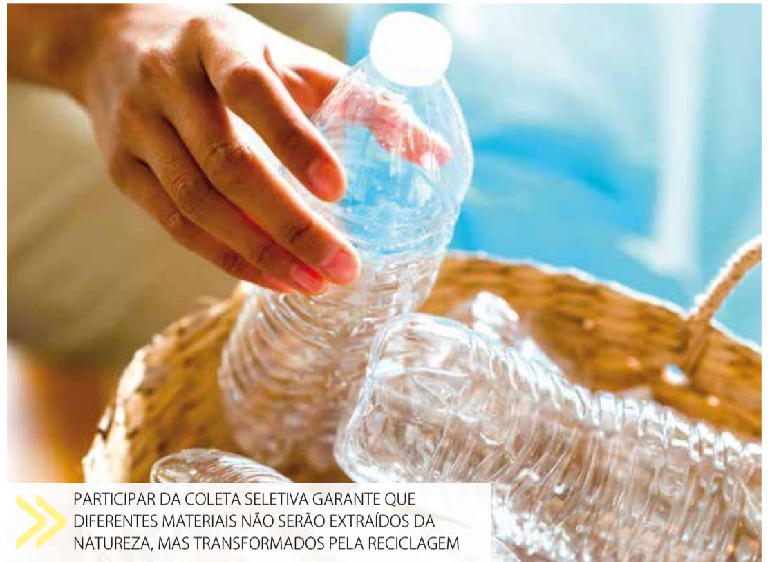
PARTICIPAR DA COLETA SELETIVA GARANTE QUE DIFERENTES MATERIAIS NÃO SERÃO EXTRAÍDOS DA NATUREZA, MAS TRANSFORMADOS PELA RECICLAGEM

Vale lembrar que que 96% das latas no Brasil são recicladas, superando os índices de países