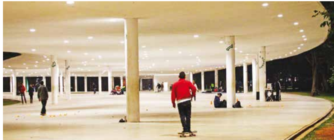
Foto de 2013, quando a marquise era um dos pontos preferidos dos visitantes do parque

A autorização para início das obras de restauração da Marquise foi assinada nessa quinta, 29 de fevereiro e prevê investimentos de quase 72 milhões por parte da Prefeitura, mas com obras executadas pela concessionária Urbia. Serão 16 meses de obras, ou seja, a reabertura para uso do público só acontece mesmo