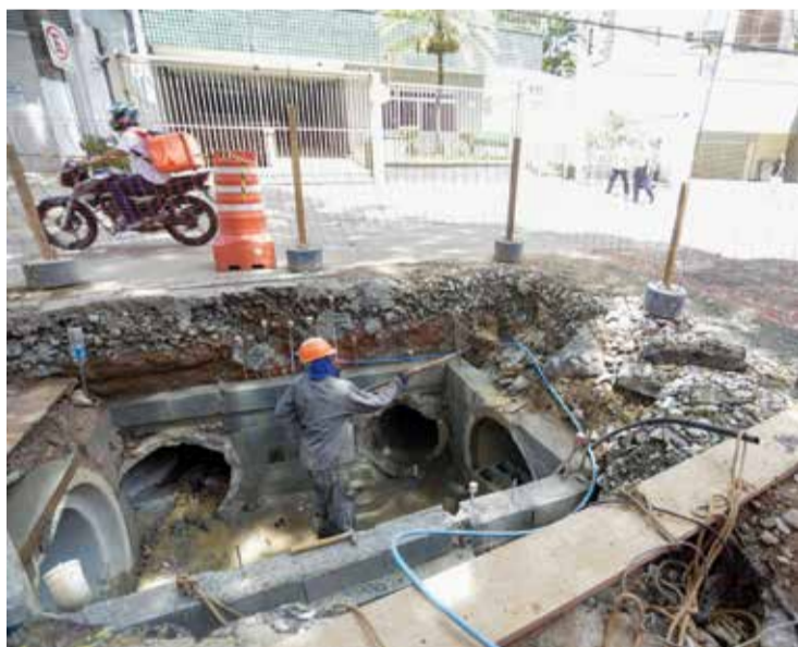
Rua Correia de Lemos concentra obras de drenagem

A obra altera a drenagem subterrânea do local, alargando os canos por onde a água pluvial passa e eliminando um afunilamento identificado pelos técnicos. Desde que os trabalhos co-