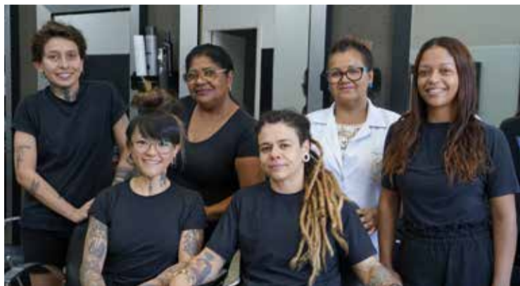
Para além dos cuidados com os cabelos, a equipe Cut & Color oferece serviços de manicure, podologia, depilação

Para evitar as pontas duplas, o aspecto “desleixado, o quebradiço, a falta de brilho e viço, a primeira coisa a ter