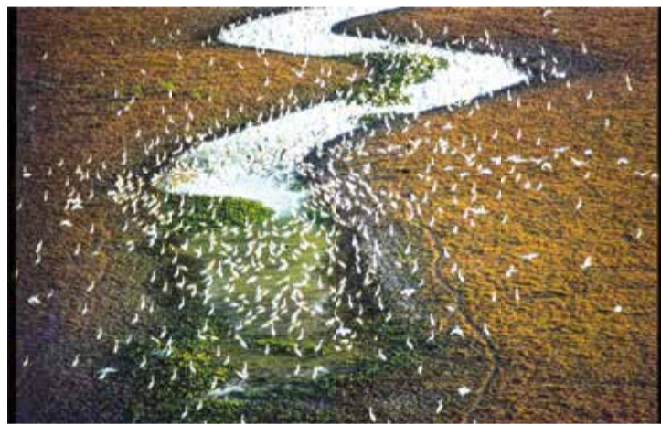
Foto de George Love, Ilha do Marajó, 1971 - Imagem que fez parte dos livros Amazônia e Alma e Luz