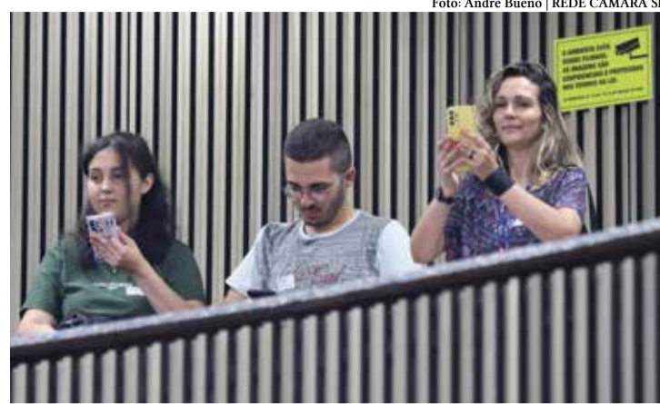
A população pode acompanhar os debates em plenário

Há diversas formas de participar das discussões em andamento na Câmara Municipal. E nem mesmo é preciso