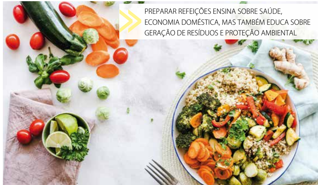
PREPARAR REFEIÇÕES ENSINA SOBRE SAÚDE, ECONOMIA DOMÉSTICA, MAS TAMBÉM EDUCA SOBRE GERAÇÃO DE RESÍDUOS E PROTEÇÃO AMBIENTAL

Mas, na vida moderna, algumas embalagens são inevitáveis: garrafas pet ou de vidro com óleos e azeite, potes com extrato de tomate ou outros concentrados, compotas, saquinhos com grãos diversos e massas secas, emba-