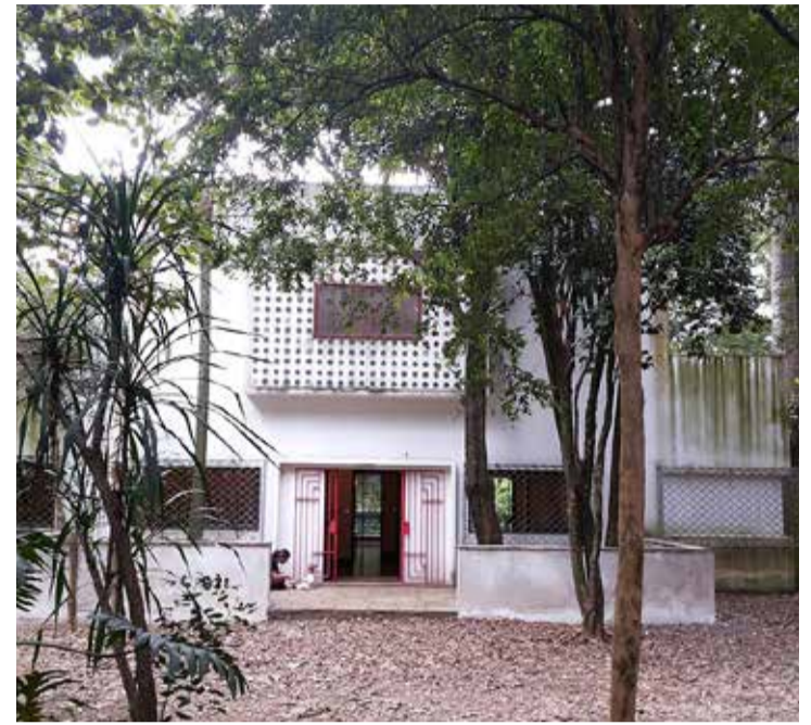
Casa do Sítio da Ressaca, no Jabaquara, e Casa Modernista, na Vila Mariana