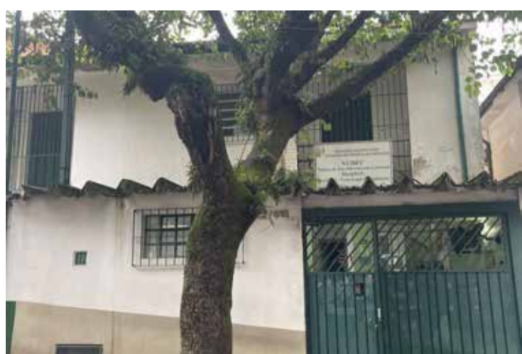
O Ambulatório de TDAH funciona no Núcleo de Ensino e Pesquisa em Envelhecimento Cerebral - Nudec

O Ambulatório de TDAH da Universidade Federal de São Paulo (Unifesp) atende pessoas de 18 a 99 anos que possuem suspeita de TDAH. Desde a sua criação, em outubro de 2022, já atendeu 40 pacientes. O ambulatório conta com uma equipe fixa de quatro neurologistas especialistas em neurologia do comportamento e um psiquiatra. Também faz parte do estágio da residência de neurologia, o que significa que os(as) residentes do último ano frequentam o ambulatório por meio de rodízios.