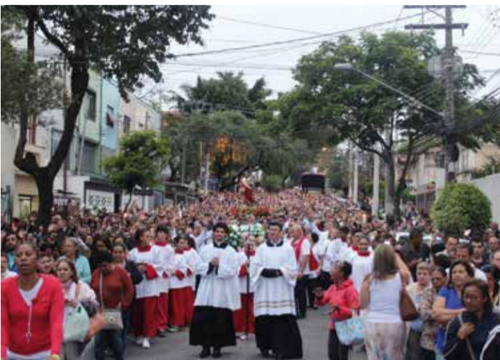
Procissões da igreja acontecem nas ruas ao redor do santuário

Objeto de discussão pública, o trecho da Alameda dos Guaiós entre as Avenidas Itacira e Piassanguaba concentra espaços importantes, como o Santuário São Judas Tadeu, que recebe grande quantidade de visitantes (com relevante presença de idosos) durante todo o ano, e o Instituto Meninos de São Judas Tadeu,