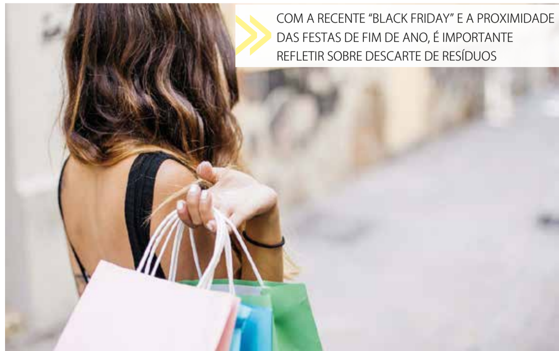
COM A RECENTE “BLACK FRIDAY” E A PROXIMIDADE DAS FESTAS DE FIM DE ANO, É IMPORTANTE REFLETIR SOBRE DESCARTE DE RESÍDUOS

Depois que passarem as festas, selecione o que pode ser reaproveitado. Mas, aquilo que não serão reutilizado no ambiente doméstico deve ser sepa-