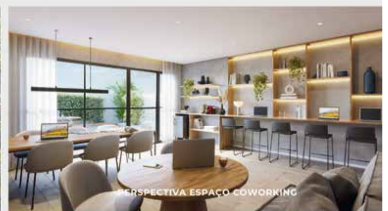
PERSPECTIVA ESPAÇO COWORKING

Visite o nosso Stand de Vendas e se maravilhe com nosso decorado . Entre e sinta-se em casa: bem-vindo ao Feel Saúde!