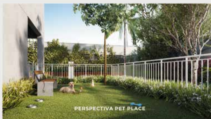
PERSPECTIVA PET PLACE