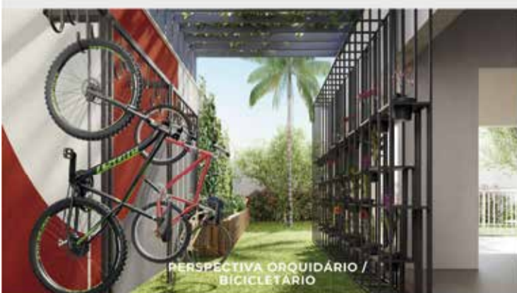
PERSPECTIVA ORQUIDÁRIO / BICICLETÁRIO

ÁREAS DE CONVÍVIO ENTREGUES JÁ EQUIPADAS!