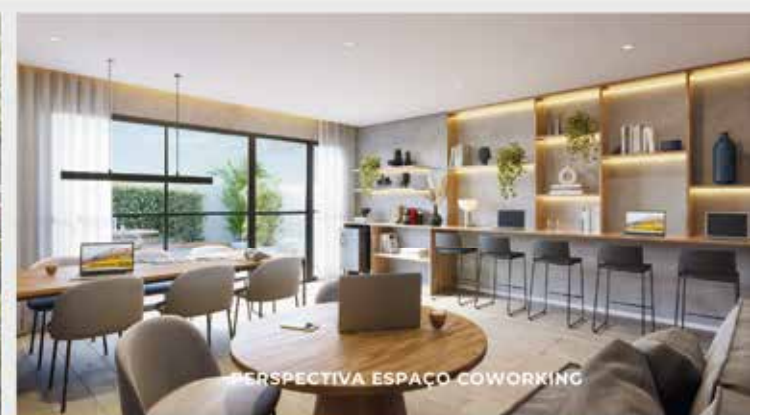
PERSPECTIVA ESPAÇO COWORKING

Visite o nosso Stand de Vendas e se maravilhe com nosso decorado . Entre e sinta-se em casa: bem-vindo ao Feel Saúde!