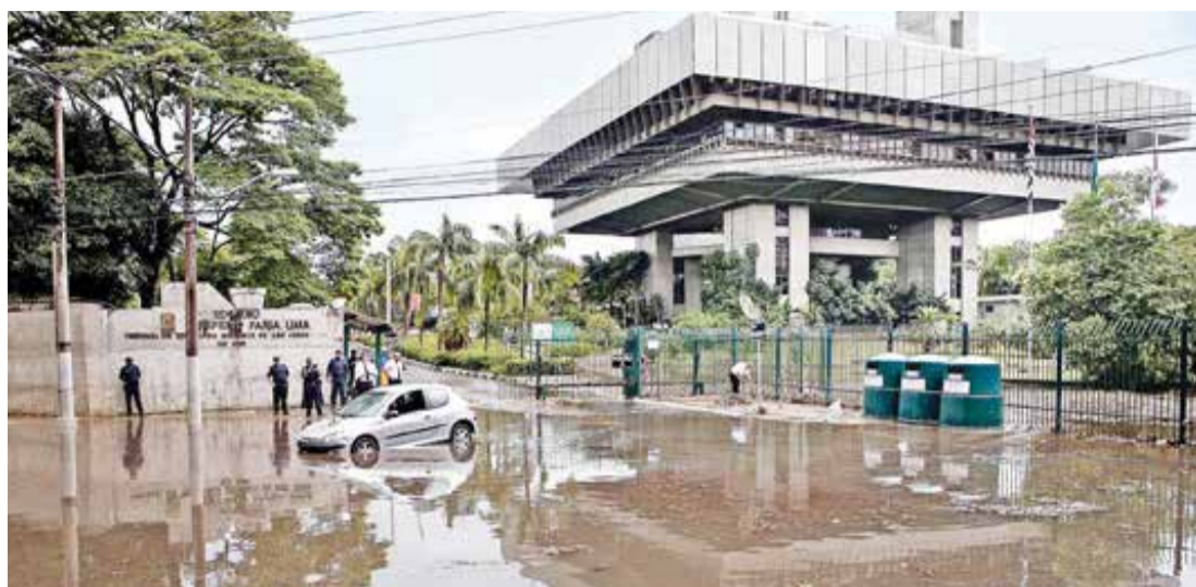
Foto de 2015 mostra alagamento em frente ao Tribunal de Contas do Município

Mas, antes mesmo de começar, a obra foi paralisada. Em julho, procurada pelo jornal SP Zona Sul, a Secretaria Municipal de Infraestrutura Urbana e Obras (SIURB) informou que a suspensão das obras de construção do piscinão Paraguai-Êguas se deu após o corpo técnico da