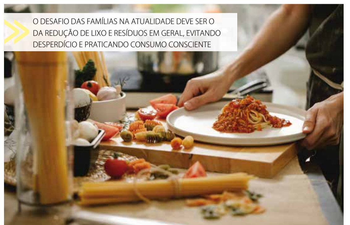
O DESAFIO DAS FAMÍLIAS NA ATUALIDADE DEVE SER O DA REDUÇÃO DE LIXO E RESÍDUOS EM GERAL, EVITANDO DESPERDÍCIO E PRATICANDO CONSUMO CONSCIENTE

A EcoUrbis Ambiental é a responsável pelos serviços de coleta tradicional e coleta seletiva