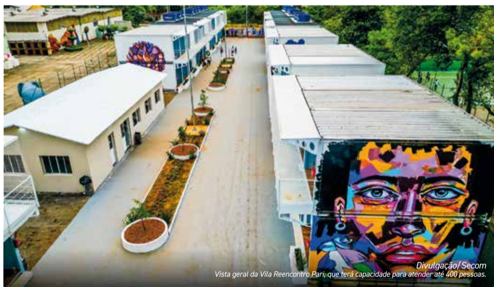
Vista geral da Vila Reencontro Pari, que terá capacidade para atender até 400 pessoas.