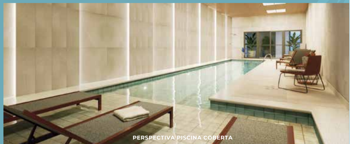
PERSPECTIVA PISCINA COBERTA