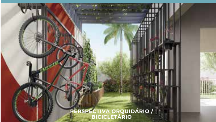
PERSPECTIVA ORQUIDÁRIO / BICICLETÁRIO