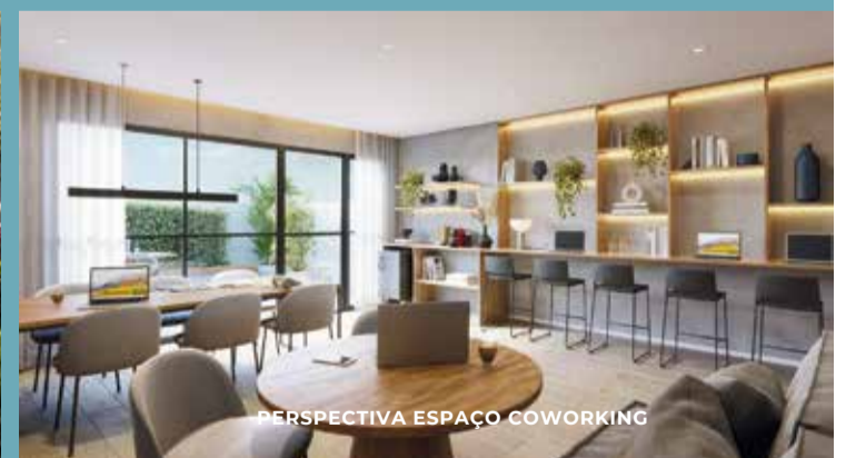
PERSPECTIVA ESPAÇO COWORKING