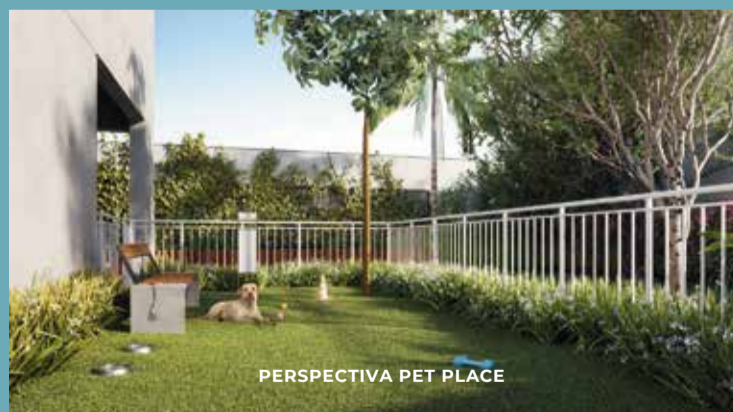
PERSPECTIVA PET PLACE