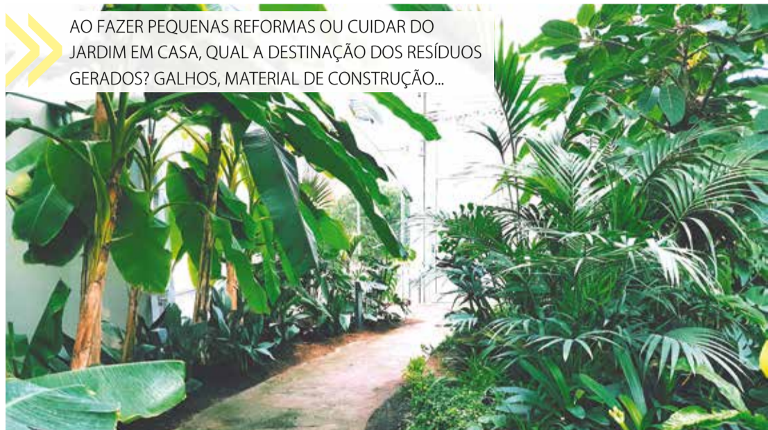
AO FAZER PEQUENAS REFORMAS OU CUIDAR DO JARDIM EM CASA, QUAL A DESTINAÇÃO DOS RESÍDUOS GERADOS? GALHOS, MATERIAL DE CONSTRUÇÃO...

mesmo os ecopontos da cidade aceitavam o gesso, que precisava necessariamente ser encaminhado para aterros especiais, por meio da contratação de caçambas regularizadas (a lista também está no site da prefeitura - capital.sp.gov.br )