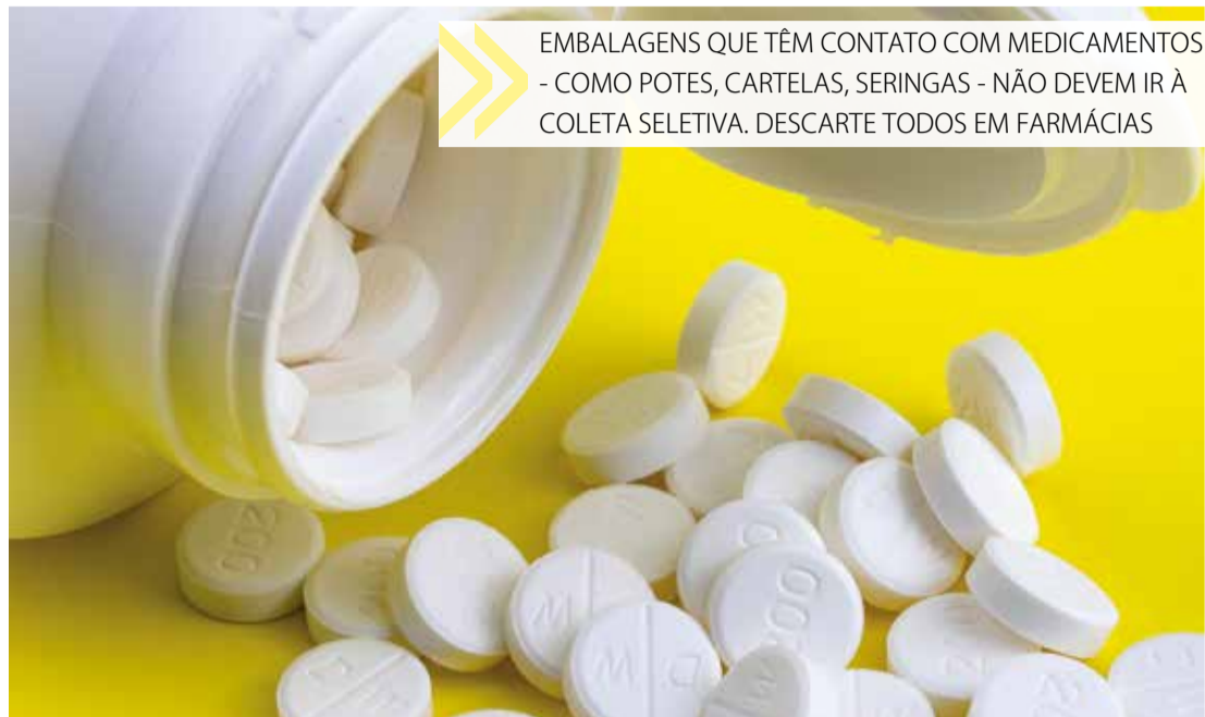
EMBALAGENS QUE TÊM CONTATO COM MEDICAMENTOS - COMO POTES, CARTELAS, SERINGAS - NÃO DEVEM IR À COLETA SELETIVA. DESCARTE TODOS EM FARMÁCIAS

Confira se as marcas que são consumidas em sua casa têm esse tipo de programa. Caso contrário, se possível, valorize aquelas que já adotam programas do tipo. Ou entre em contato com o Serviço de Atendimento ao Consumidor de sua