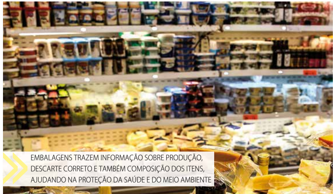
EMBALAGENS TRAZEM INFORMAÇÃO SOBRE PRODUÇÃO, DESCARTE CORRETO E TAMBÉM COMPOSIÇÃO DOS ITENS, AJUDANDO NA PROTEÇÃO DA SAÚDE E DO MEIO AMBIENTE

Número 6 – PS – Poliestireno: canudos, copos, pratos e talheres descartáveis, embalagens de ovos e outras de produtos racionados.