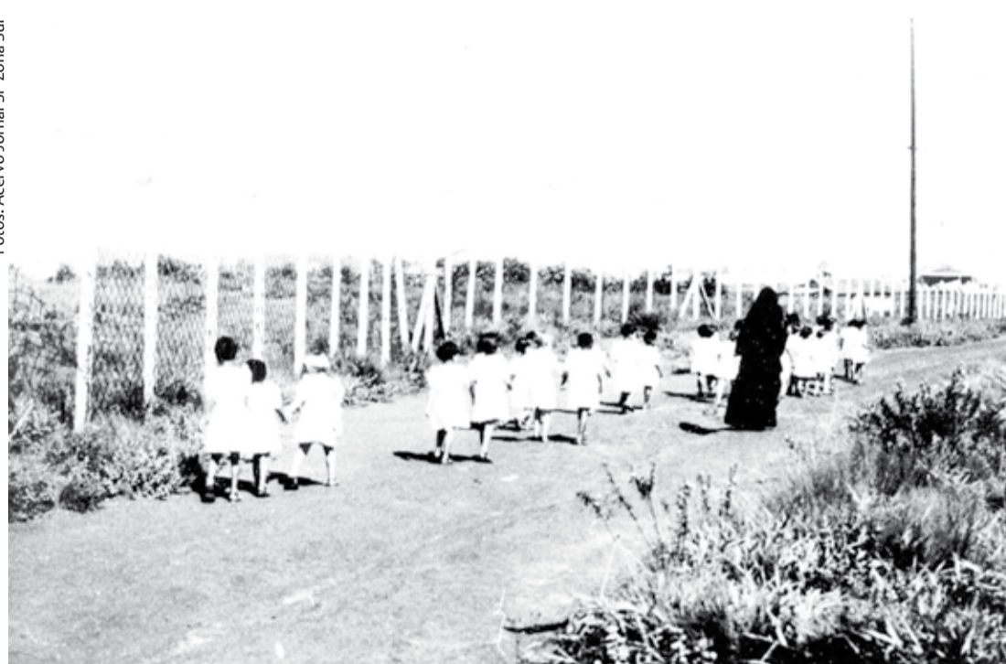
Acima, freira passeia com estudantes ao longo da pista de Congonhas na década de 1950. Abaixo, foto feita por leitor do jornal SP Zona Sul no ano da inauguração de Congonhas: 1936

Vale observar, entretanto, que a própria definição do bairro como Zona Residencial