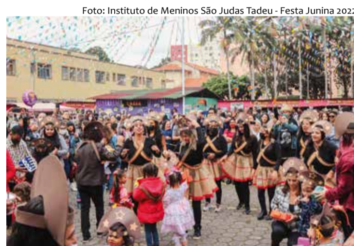
Festa Junina 2022

feira vai acontecer dias 28 de maio, 4, 11, 18 e 25 de junho, das 10h às 21h.