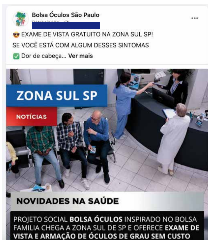
Anúncios imitando notícia usa imagens de equipamentos públicos ou informações sobre projeto social inexistente

No momento em que entra em contato, o interessado é informado que o currículo precisa ser aprimorado e que o ideal é fazer um curso. Posteriormente, com aquela