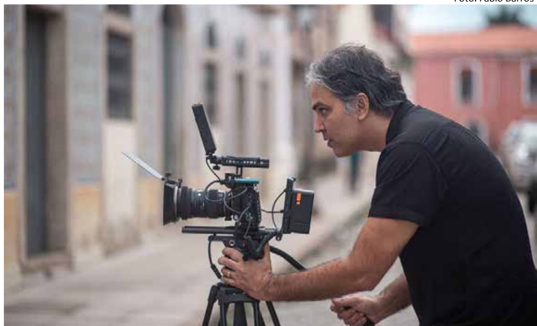
O premiado cineasta Arturo Saboia assina a direção e o roteiro do filme, que será lançado no dia 18/03 com debate e exibição na Cinemateca Brasileira, na Vila Mariana

E, por fim, uma outra faceta de vanguarda, o Manoel