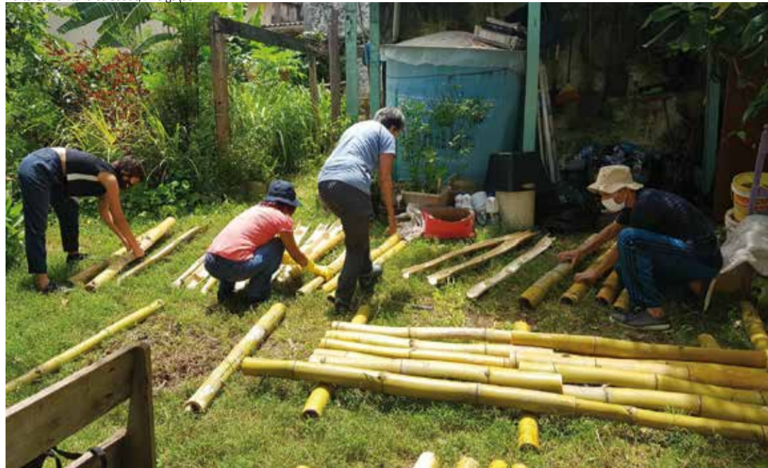
O prefeito Ricardo Nunes lançou o programa Sampa + Rural essa semana, com o objetivo de estimular mais iniciativas como a Horta da Saúde(acima) e agroecologia

ser acessada de qualquer dispositivo conectado com a internet, divulgando e conectando agricultores locais, estabelecimentos parceiros de produtores, roteiros turísticos e muito mais. Acesse e conheça sampamaisrural.prefeitura.sp.gov.br.