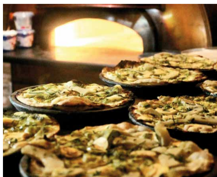
Primavera, verão, outono, inverno... Todas as estações têm sabor especial para os clientes GattoFiga

No dia da Pizza, em 10 de julho, a festa foi com a participação de Ongs que atendem animais, como a Cão Sem