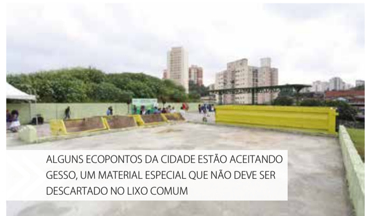
ALGUNS ECOPONTOS DA CIDADE ESTÃO ACEITANDO GESSO, UM MATERIAL ESPECIAL QUE NÃO DEVE SER DESCARTADO NO LIXO COMUM

No caso do isopor, os municípios podem destinar na coleta seletiva ou na ReciFavela, uma das cooperativas habilitadas da Prefeitura. Como alternativa para o descarte correto de resí-