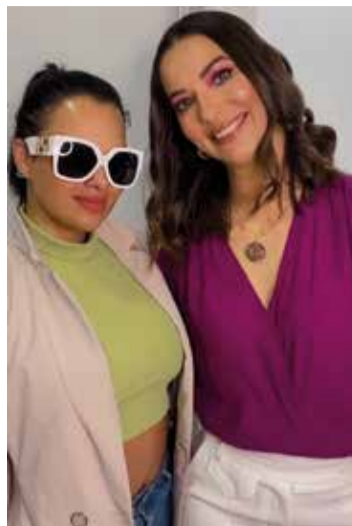
O apresentador de tv Rogério Moretto e a atriz e comediantes Priscila Menucci