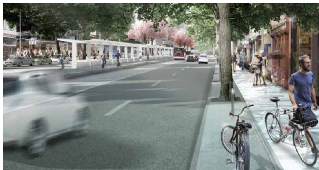
Perspectiva prevista para a avenida após obras, com faixa aterrada

Atualmente, o corredor conta com faixas exclusivas para ônibus, canteiros centrais com paradas que faci-