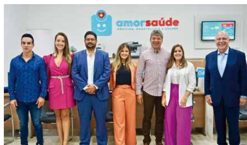
A inauguração Ipiranga da AmorSaúde contou com lideranças empresariais e políticas, que puderam conhecer toda infraestrutura dos consultórios médicos e odontológicos. A unidade tem capacidade para oito mil atendimentos por mês

Para mais informações sobre o AmorSaúde, suas unidades e condições especiais de pagamento, acesse: amorsaude.com.br/