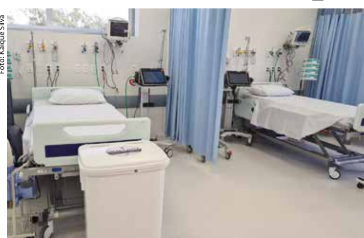
Nova ala permanecerá instalada mesmo após a pandemia

Para o vereador, a nova UPA 24 horas vai desafogar o pronto socorro do hospital Saboya, mesmo no futuro, com a pandemia sob controle. “E o Hospital na Vila Santa Catarina tem um atendimento