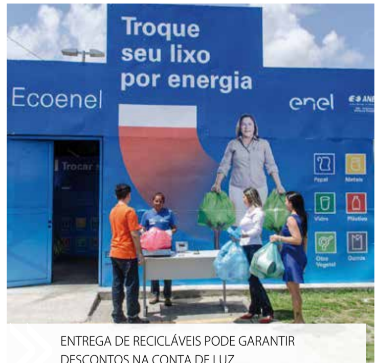
ENTREGA DE RECICLÁVEIS PODE GARANTIR DESCONTOS NA CONTA DE LUZ

Após o cadastro, o cliente poderá levar os resíduos pré-separados por tipo até o ponto de sua preferência. Lá, eles serão pesados e o valor do bônus creditado automaticamente na conta de energia. Cada resíduo tem seu valor em quilo, unidade ou litro e, caso o valor da bonificação seja