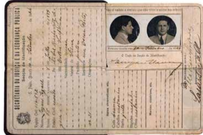
Carteira de identidade brasileira de Lasar Segall

O Museu, então, passou a examinar os documentos e desenvolveu nova pesquisa, reveladora de fontes primárias comprobatórias. A conclusão foi de que "há uma linha coerente e solidamente comprovada, por documentos sucessivos, e a partir do oitavo dia do nascimento, até 1945 pelo menos, em que o ano de nascimento de 1889 se